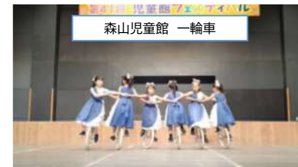
森山児童館 一輪車