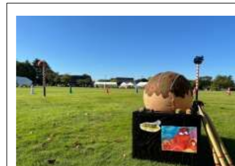
ジャンボたこ焼き 運べるかな?