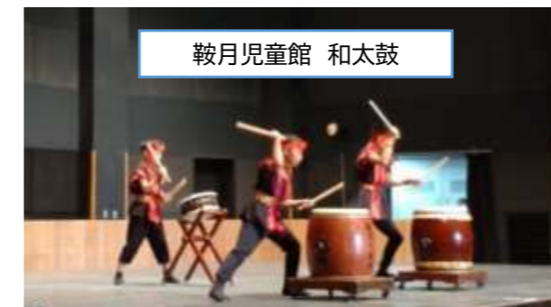
鞍月児童館 和太鼓