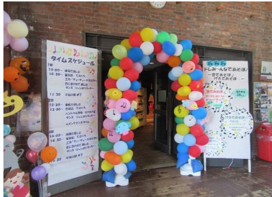
ミュージック工房入口をバルーンアーチで飾りました

【内容】 ♪楽器あそび…楽器に触れて楽しむ 工作でチューチューネズミを作り、音に合わせて楽しむ ハンドベルで『きらきら星』をみんなで演奏 ♪劇あそび…音楽劇『てぶくろ』を厚生員が熱演 ♪ダンス…『ジャンポリミッキー』をネズミの耳のカチューシャをつけてダンス