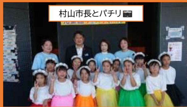
村山市長とパチリ