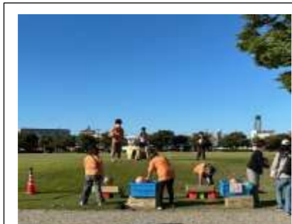
ねらって ねらって 笹舟にイン!