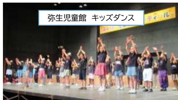
弥生児童館 キッズダンス