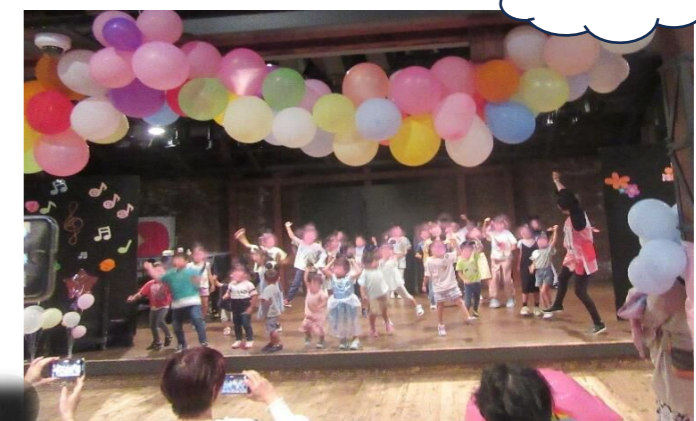
ミッキーの耳のカチューシャを付けてダンス♪大盛り上がり!!