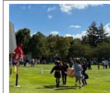
落とさないように バランスとって