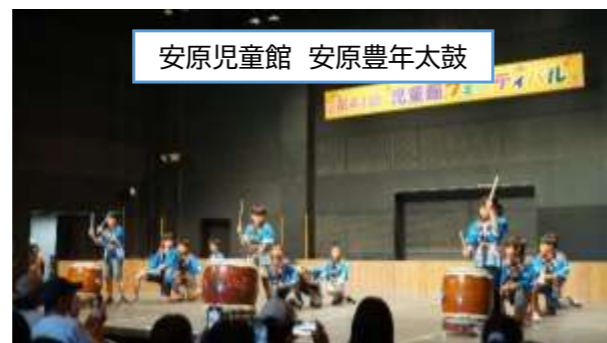
安原児童館 安原豊年太鼓