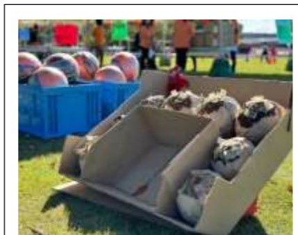
大きなたこ焼き 入るかな?