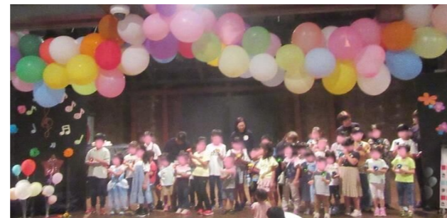
みんなでハンドベルを演奏♪とても上手でした!