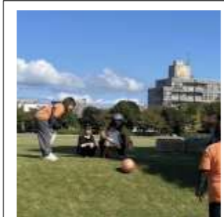
小さなお友だちもコロコロ~♪