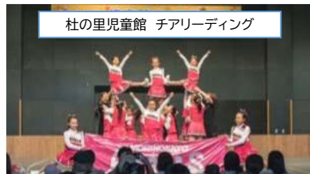
杜の里児童館 チアリーディング