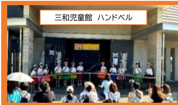
三和児童館 ハンドベル

パフォーミングスクエア内の特設ステージでは17館495名の子どもたちが出演し、バラエティ豊かな活動発表が行われました。出演者と先生方の熱い想いがこもった発表の数々に、2000人を超えるたくさんの方が応援に駆けつけ、観客席もステージ上も充実感に満ちた笑顔に溢れていました。