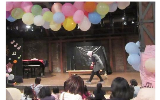
厚生員の熱演を真剣に観る子どもたち