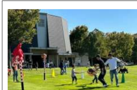
パパと一緒に はこんで はこんで