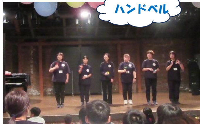
厚生員によるハンドベルの演奏♪