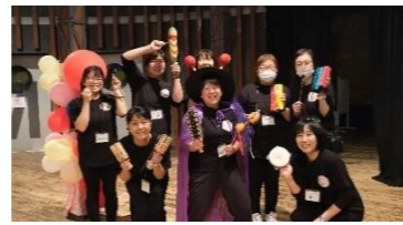
開会宣言終了後にもアピール