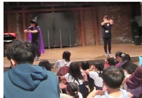
合間のひと時『一匹の野ネズミ』