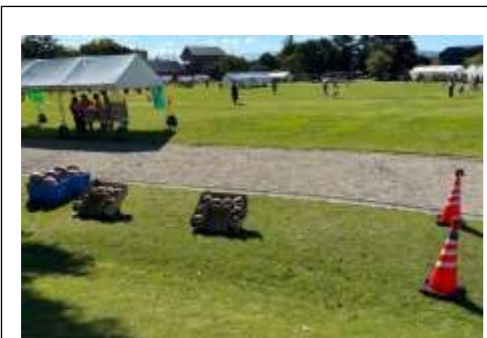
なだらかな斜面をのぼって スタンバイ☆

たこ焼きボール(直径約25cm)を1人2球持ち、 なだらかな斜面の上から 笹舟を模した箱をめがけて コロコロ♪ うまくころがって、笹舟に入ったらチャレンジ達成!