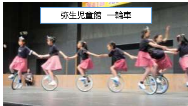
弥生児童館 一輪車