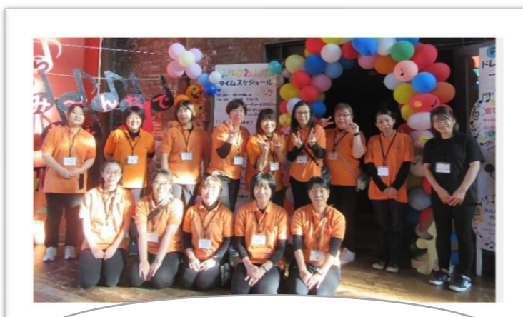
3ブロックのみなさんと一緒にハイチーズ!