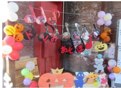
ハロウィンの装飾でお出迎え