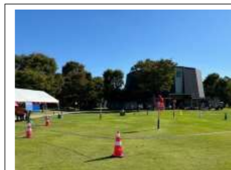
3本のモニュメントが 目印になるコース

たこ焼きボール(直径約50cm)を4本の爪楊枝に見立てた ゴム付き棒で持ち上げ、3本のモニュメント(たこ焼き・タコ・青のり)を 一周するコース。30秒以内に見事クリアできれば、チャレンジ達成!