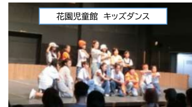
花園児童館 キッズダンス