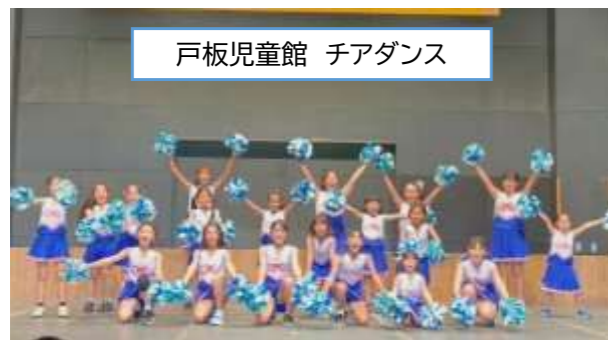
戸板児童館 チアダンス