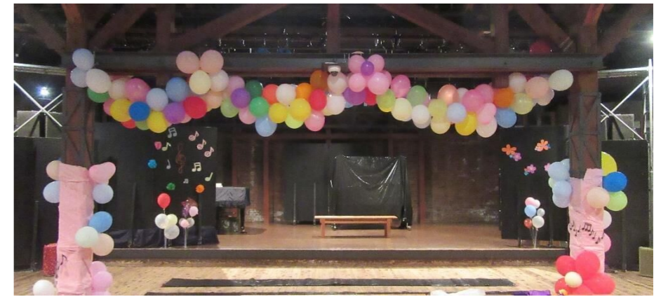
ミュージック工房内も風船で飾りました