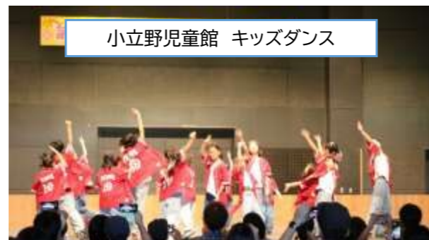
小立野児童館 キッズダンス