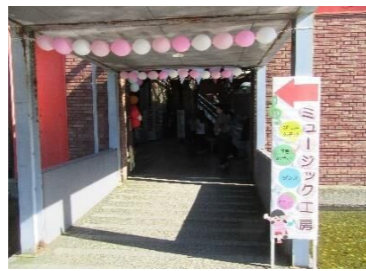
オープンスペース入口